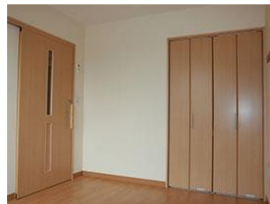
↑居室 個室にてプライバシーを守り、ご自分の時間を大切にとる事が出来ます。