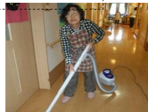
掃除もやりますよ～