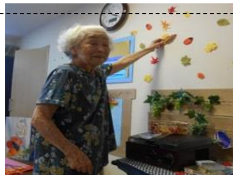
季節感を出さなきゃ