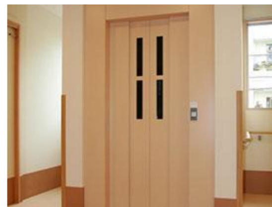
↑エレベーター 車イスでも安心のエレベーター。