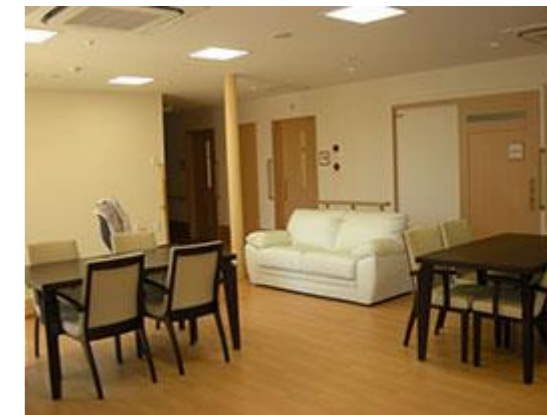
↑居間・食堂 職員9人の顔なじみの方達と食事、団らの時間を楽しんで頂けます。