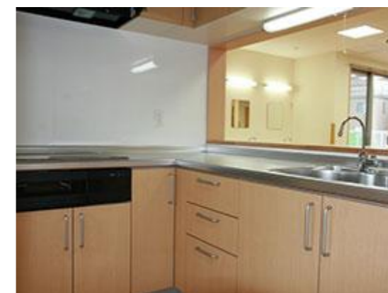
↑キッチン スタッフと一緒に料理づくり、食器洗い等、行って頂けます。対面式のキッチン。