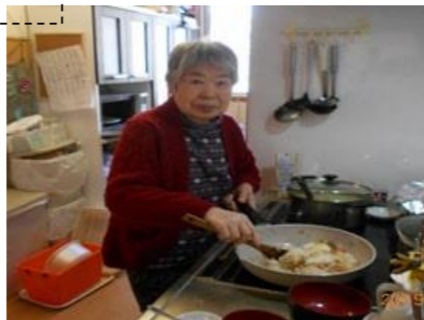
夕飯は任せておいてね