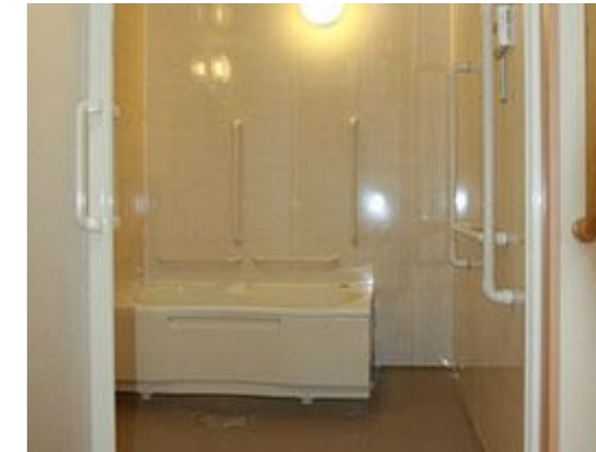
↑バスルーム 毎日入浴。 個室にてゆったりとお入り頂けます。