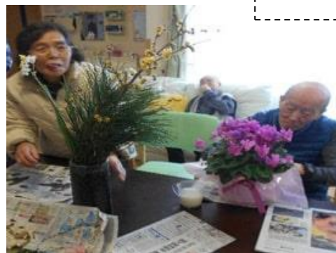
色々準備がありますね