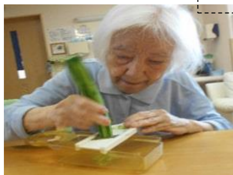
きゅうりのスライス中