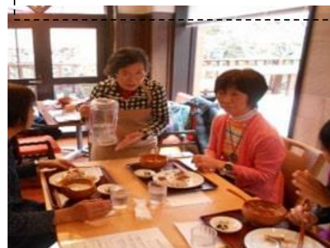
豆腐屋カフェのウェイトレス