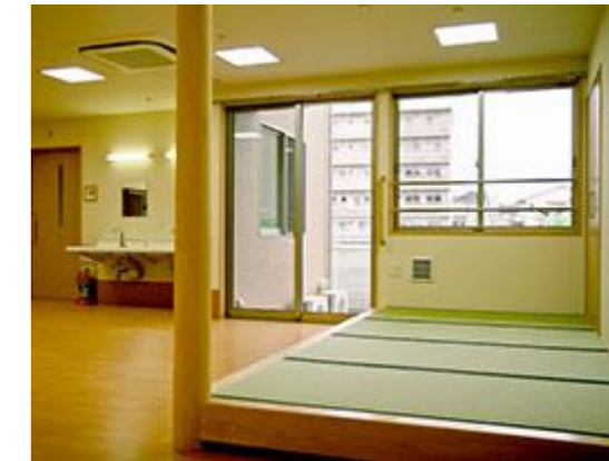
↑和室 畳の匂いを感じながらくつろいで頂けます。